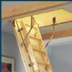
Půdní skládací schody